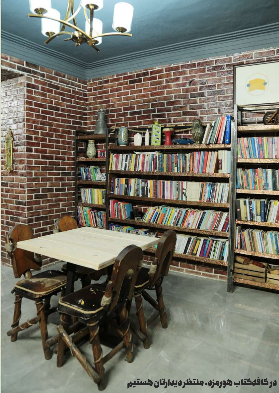
در کافه کتاب هورمزد، منتظر دیدارتان هستیم